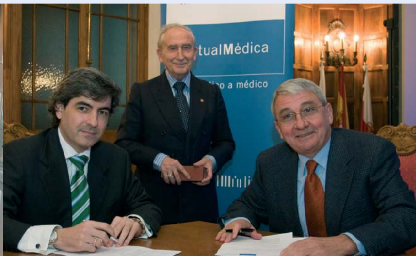
El convenio de colaboración entre Mutual Médica y el Colegio de Médicos de Cantabria se firmó en el Palacio de la Magdalena de Santander.